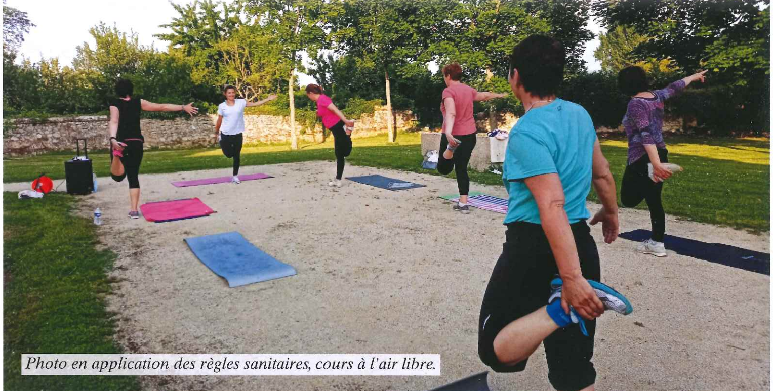
Photo en application des règles sanitaires, cours à l'air libre.